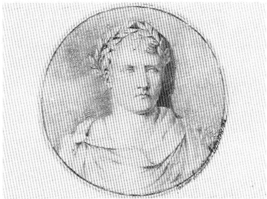
2. Portret Napoleona, rysunek z „Albumu Jenny”, rys. Józefina Kossakowska, 1812; w zbiorach Muzeum Narodowego w Warszawie.