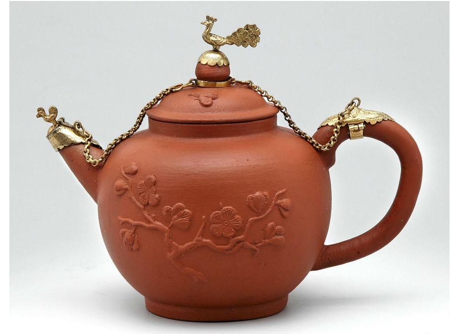
Imbryk z pokrywką