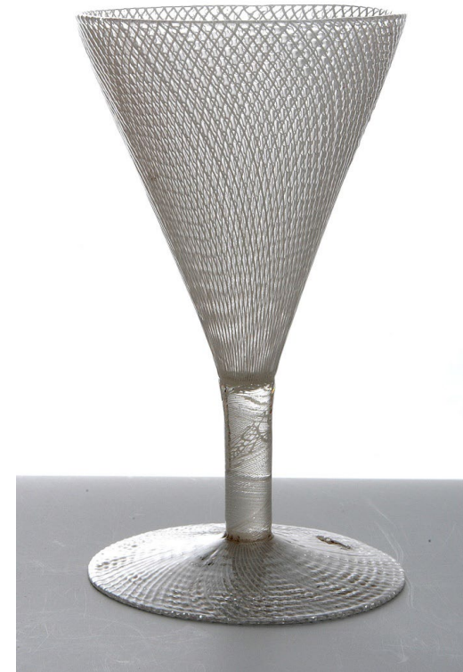
kieliszek ze szkła weneckiego

W zbiorach wilanowskich jest tylko jeden kieliszek ze szkła weneckiego.