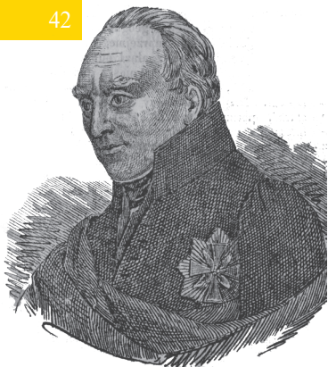
X. Stanisław Staszic.