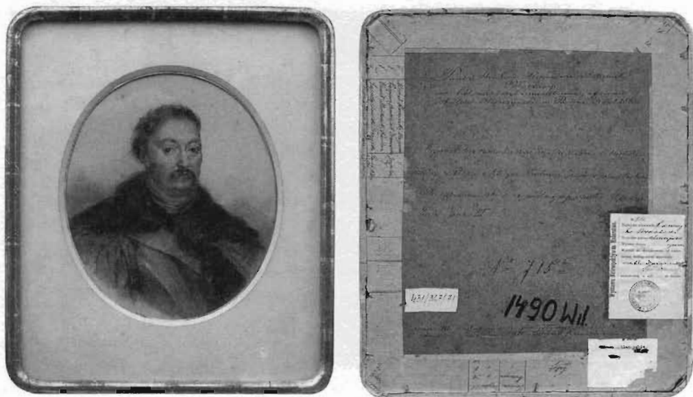
il. 4 Portret Jana III, rysunek autorstwa Antoniego Oleszczyńskiego, lico i odwrocie, Wil.1490, Muzeum Pałac w Wilanowie