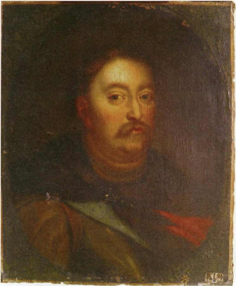
▲ Portret Jana III, MV 6617, zbiory Pałacu w Wersalu