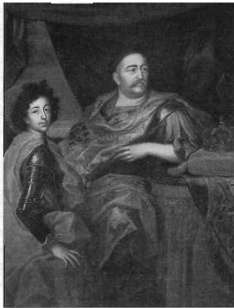
s. 177 ► il. 2 Portret Jana III z synem Jakubem, Wil.1154, Muzeum Pałac w Wilanowie

w Wersalu 3 w ramach programu Leonardo da Vinci – uczenie się przez całe życie . Wspólny ogląd obu portretów króla Jana III pozwolił na przeprowadzenie ogólnej analizy zarówno od strony konserwatorskiej jak i artystyczno-ikonograficznej.