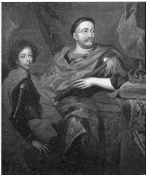
s. 178 ► il. 1 Portret Jana III z synem Jakubem, MV 3550, zbiory Pałacu w Wersalu