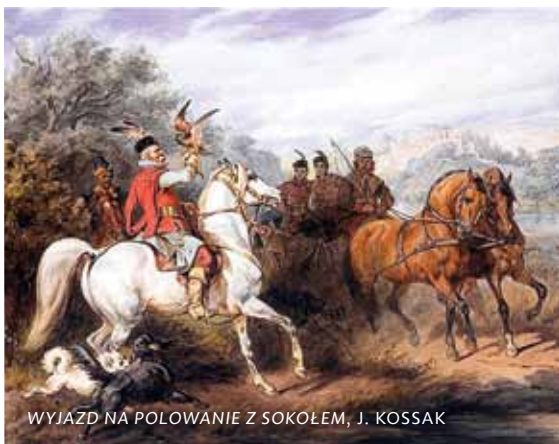
WYJAZD NA POLOWANIE Z SOKOŁEM, J. KOSSAK