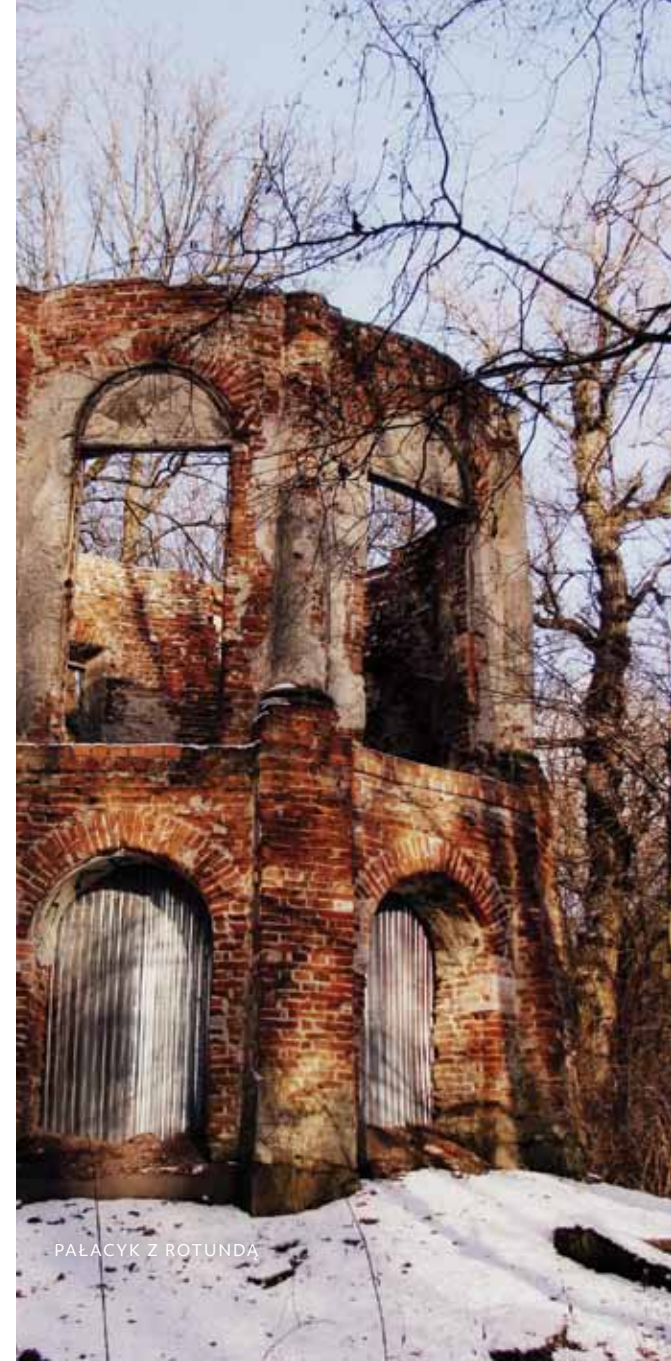
PAŁACYK Z ROTUNDĄ

Z budowli pozostało niewiele, dziś możemy oglądać wyłącznie mury rotundy. Ruiny stoją obecnie daleko od wody, ale w czasach Potockich do pałacyku, który połączony był osią widokową z Mostem Rzymskim, można było dopłynąć łódką z Wilanowa.