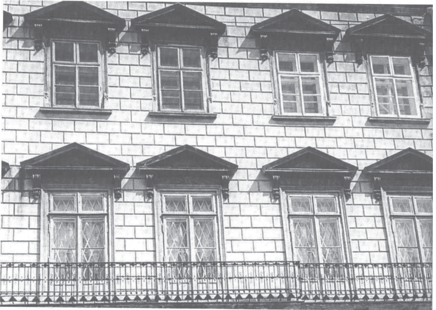
Widok fragmentu frontu kamienicy królewskiej we Lwowie.

Paterna Krolowey Jeym. zapłaconych comportować y copmensować będzie ex Materna Substantia. Wzajemnie także Nayiasnieyszemu Krlc o wi Im Akexandrowi Dway Nayiasnieysi Krlcowie Ichmc ex amicabili mediatione Maiętnosc Podhorecką Z Pałacem pro Sortibus suis wiecznemi czasy daią daruią y Onę w Dział Krlc o a Im. Alexandra ze Wszystkim odstepuią tak iako samym nalezec miała abo mogła.