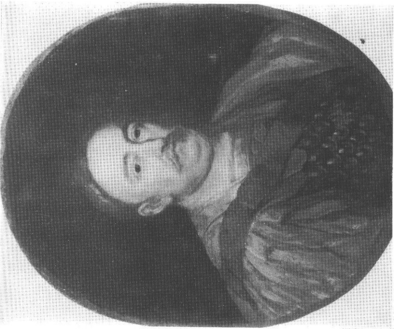
4. Jerzy Eleuter Siemiginowski? Portret Jana III.