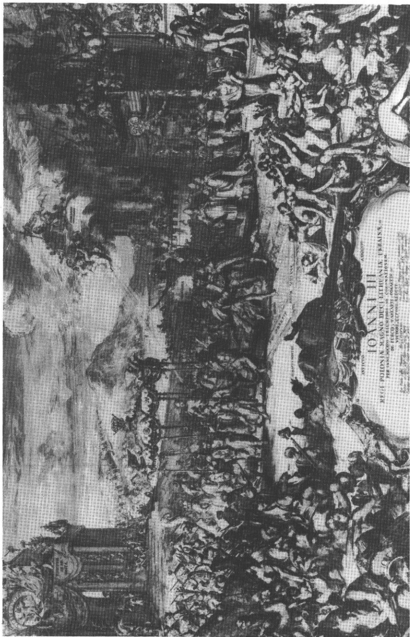
1. Romeyn de Hooghe. Wjazd Sobieskiego na koronację do Krakowa. Akwaforta.