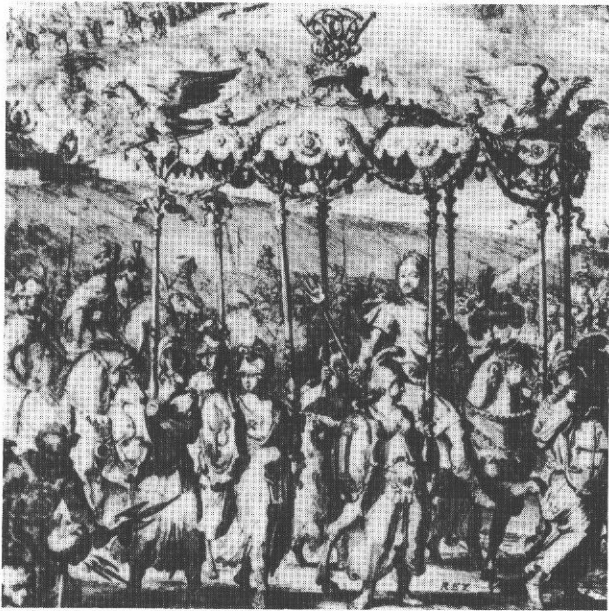
3. Fragment sztychu: Jan III pod baldachimem.