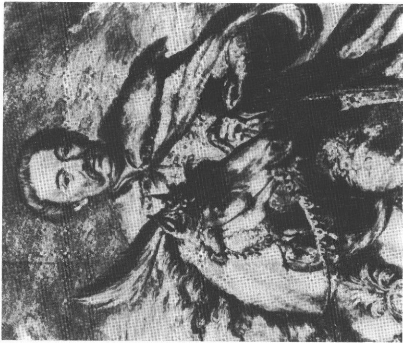
5. Romeyn de Hooghe. Fragment ryciny 'Jan III na tle bitwy chocimskiej'.