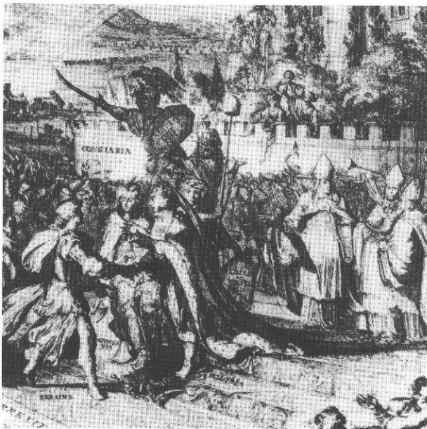
4. Fragment sztychu: Personifikacje trzech krajów Rzeczypospolitej.