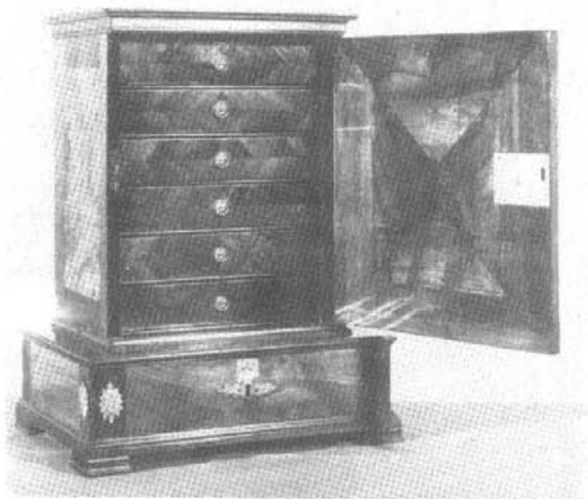
3. Medaliera ze zbiorów wilanowskich, Francja kon. XVIII w. (otwarta)