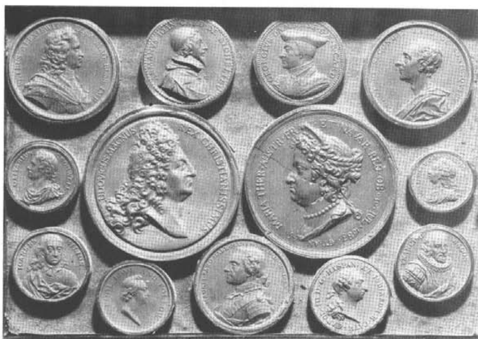
4. Odejski medali europejskich – zachowany fragment kolekcji S. K. Potockiego, Fot. B. Serebyńska.