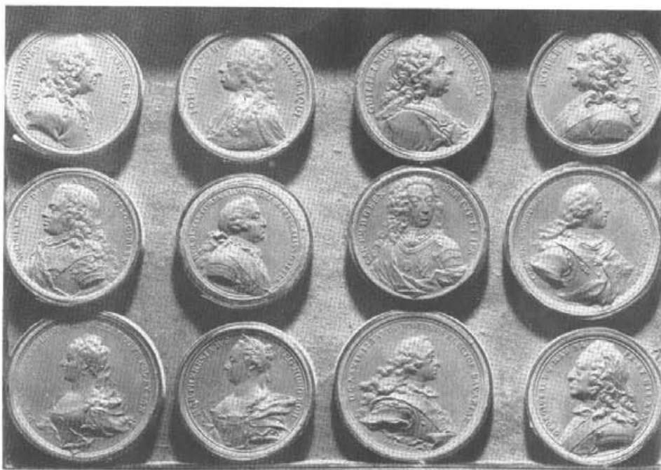
5. Odciski medali europejskich – zachowany fragment kolekcji S. K. Potockiego.