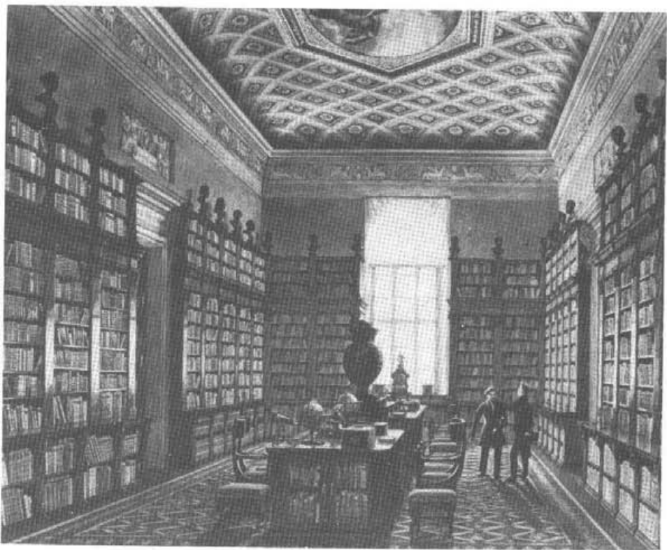
1. Wnętrze Wielkiej Sali Bibliotecznej z widocznymi na parapecie okna medalierami (por. il. 2 i 3), wg W. Kasprzyckiego z ok. 1838 r.