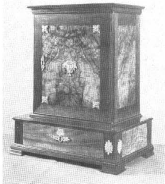
2. Medaliera ze zbiorów wilnowskich. Francja kon. XVIII w. (zamknięta).